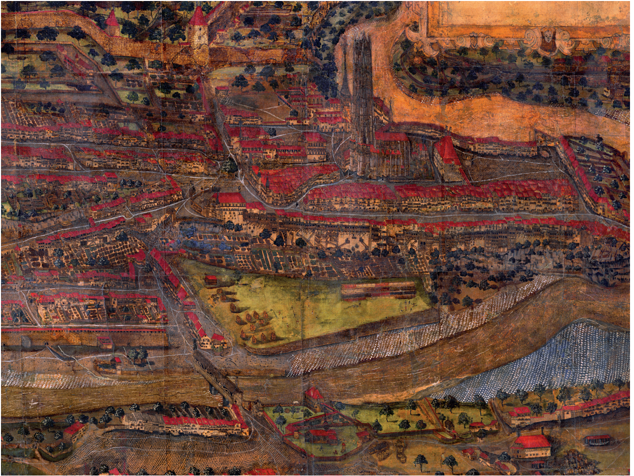
Grégoire Sickinger Plan de Fribourg, 1582 Détail

En 1582, le peintre, dessinateur, graveur sur bois et sur cuivre Grégoire Sickinger, originaire de Soleure, remit au Conseil de Fribourg une grande vue à vol d'oiseau de la ville. Longtemps accrochée aux cimaises de l'Hôtel de Ville, en signe de fierté et de prestige, elle tomba ensuite dans l'oubli. Seules des circonstances heureuses lui ont permis de survivre à l'épreuve du temps. Cette vue, désignée simplement aujourd'hui sous le nom de «Plan Sickinger», n'est pas seulement la plus grande œuvre de ce type existant encore en Suisse. Elle constitue aussi un jalon essentiel dans l'histoire des vues de Fribourg, tout en offrant un document inestimable pour l'histoire et l'histoire de l'art.