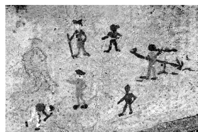
Le jeu du «Hornuss»