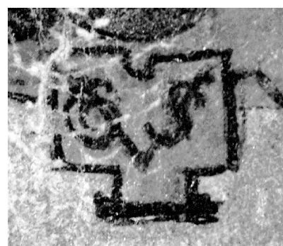
Le monogramme de Grégoire Sickinger