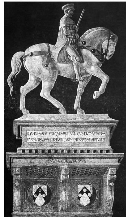
Paolo Ucello Reiterbildnis des John Hawkwood 1436, Florenz, Dom