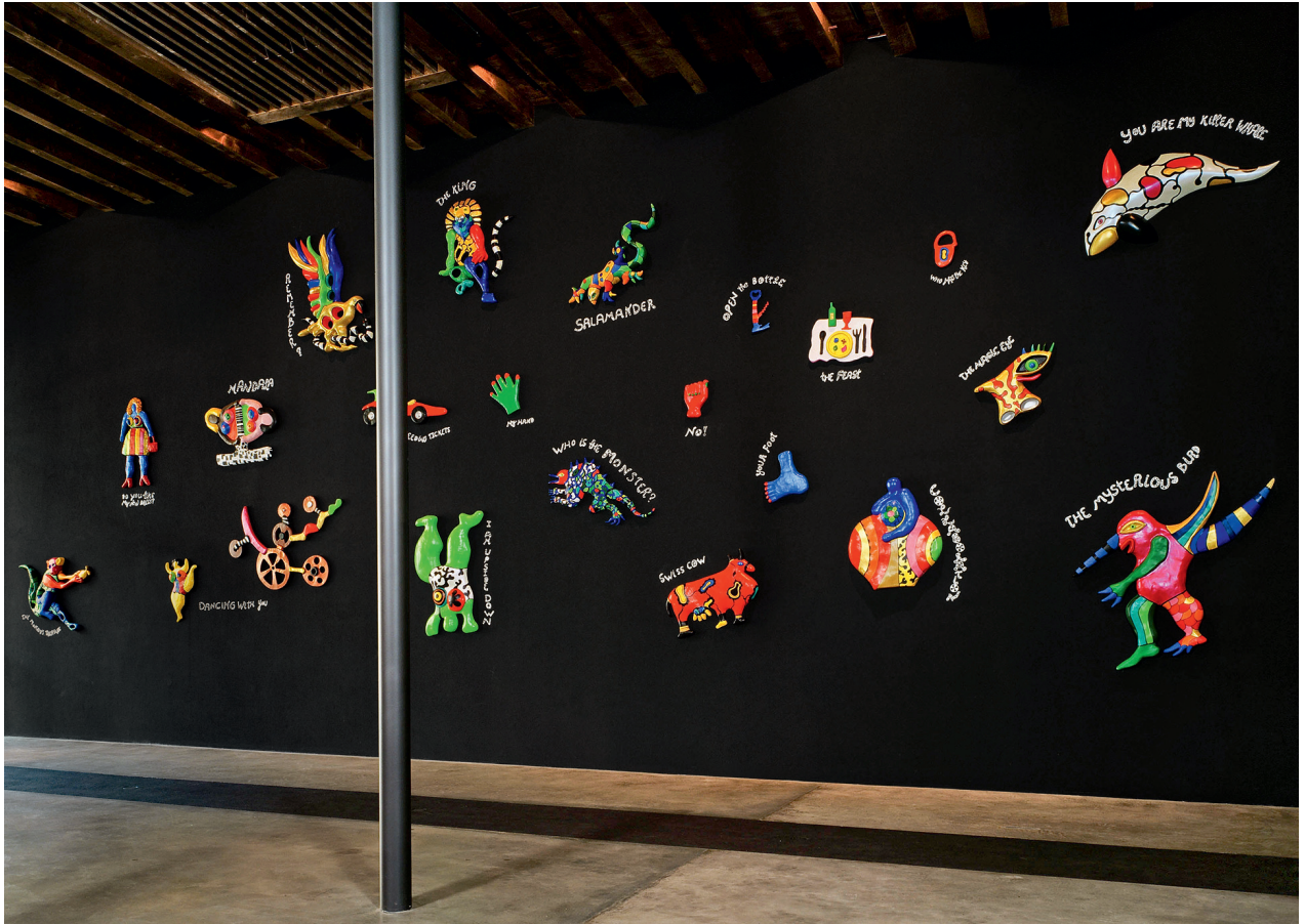
Niki de Saint Phalle «Remembering» 1997–1998

C'est à l'occasion de la transformation de l'ancien dépôt des tramways de Fribourg en «Espace Jean Tinguely-Niki de Saint Phalle» que celle-ci crée en 1997–1998 le relief monumental et coloré «Remembering» qu'elle offre au musée. Les vingt-deux motifs en polyester peint éclairent comme des flashes les étapes de sa vie, tout en témoignant de sa relation intense avec Jean Tinguely, son second mari. Nanas déchaînées, animaux aux couleurs vives, objets du quotidien et créatures fantastiques engendrent, à la manière d'un kaléidoscope, une multitude d'images, d'idées et de sensations. Selon Niki de Saint Phalle, «Dancing with you» – avec sa Nana pleine d'entrain et ses roues couleur rouille aux rotations fantaisistes – constitue l'âme de l'œuvre et symbolise la complicité artistique du couple. Le relief monumental n'existe dans son intégralité qu'à l'«Espace» de Fribourg, même si quelques-uns de ces reliefs ont été réalisés plus tard pour des collectionneurs privés.