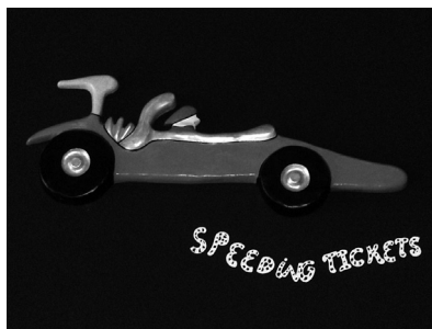
«Speeding tickets», 1997–1998