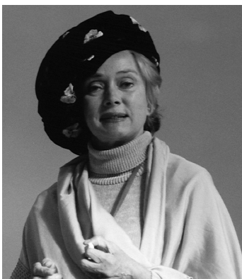
Niki de Saint Phalle à La Jolla Californie, 1996