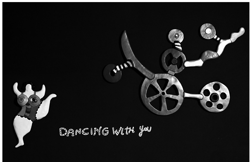
«Dancing with you», 1997–1998

Les reliefs Swiss cow et Speeding tickets rappellent le temps passé ensemble en Suisse. Niki fut longtemps considérée comme une simple assistante dans l'ombre de Tinguely. Or, d'importantes expositions seront consacrées à son œuvre au Musée d'art et d'histoire en 1993–1994 et à l'Espace en 1999 (rétrospective et premières œuvres). Elle connaît la Suisse grâce à ses fréquents séjours en clinique et aux cures qu'elle a dû subir en raison d'une affection chronique des voies respiratoires provoquée par la poussière de polyester. Ses souvenirs de la période fribourgeoise avec Jean Tinguely sont liés à la fascination de l'artiste pour les moteurs et les voitures rapides. Il suivait avec passion les courses de Formule 1 qui lui firent connaître en 1964 le cou-