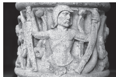
Fontaine de la Samaritaine Triton avec couteaux de tanneur