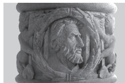
Fontaine de la Samaritaine Portrait supposé de Nicolas de Flue