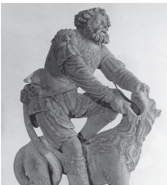
Hans Gieng Fontaine de Samson, 1547 Musée d'art et d'histoire Fribourg

A Fribourg, six fontaines présentent des thèmes religieux (saint Pierre, saint Georges, saint Jean, Samson, sainte Anne trinitaire et la Samaritaine), thèmes qui expriment probablement la volonté de la ville d'afficher son catholicisme. On rencontre également des allégories (la Force, le Courage, la Fidélité) et des porte-bannières (Sauvage). L'identification des personnalités du Courage et de la Fidélité est aujourd'hui remise en question: la première correspond sans doute plutôt à une allégorie de la Colère, tandis que la seconde serait peut-être un porte-drapeau.