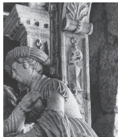
Fontaine de la Samaritaine Crâne et sablier