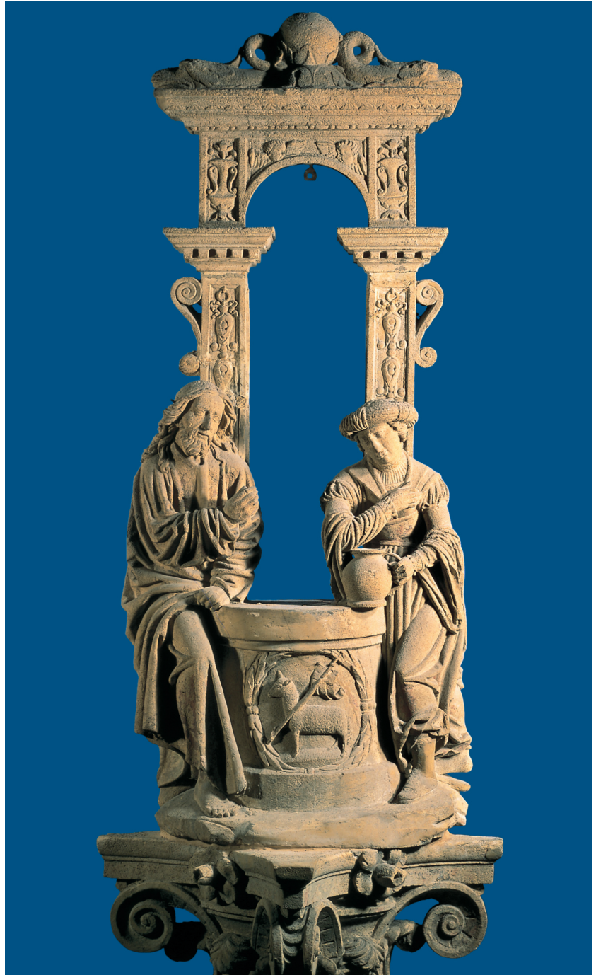
Hans Gieng Fontaine de la Samaritaine 1550/51

Réalisée par Hans Gieng en 1550–1551, la «Fontaine de la Samaritaine» fait partie d'un ensemble de dix fontaines à figures qui ont vu le jour à Fribourg au XVI e et au début du XVII e siècle. Au cours du XVI e siècle, les fontaines en bois de nombreuses villes de Suisse furent en effet remplacées par des fontaines en pierre ornées de statues; saints protecteurs des cités, porteurs de bannières ou de drapeaux, mais aussi allégories comptaient parmi les thèmes de prédilection. Le sujet ici choisi – Jésus et la Samaritaine près du puits de Jacob (Jn 4, 1–42) – est un motif qui n'avait manifestement jamais été traité auparavant dans des fontaines publiques. Contrairement aux autres fontaines fribourgeoises, celle de la Samaritaine n'illustre donc pas un motif traditionnel, mais un sujet inédit et original.